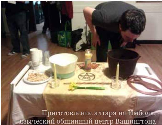
Приготовление алтаря на Ймболк, языческий общинный центр Вашингтона

разу не услышал ни насмешки, ни злого слова в адрес этих домашних проповедников, и в адрес проповедников публичных тоже. В «метафизическом магазине», где постоянно устраиваются чтения Таро, целительные сеансы Рэйки, медитации, языческие саббаты и шаманские классы, наряду с викканскими, африканскими и тибетскими атрибутами на полках я нашел статуэтку Святой Софии с крыльями (как на русских иконах), медальоны с Богоматерью и почитаемыми святыми – Франциском, Антонием, Иосифом. Помимо чисто коммерческих соображений, такой ассортимент несет еще и педагогическую функцию. Владелец магазинчика сказал мне: «Мы торгуем атрибутикой разных традиций, потому что мы все разные». При этом язычники живут каждой своей традицией, не стремясь вербовать сторонников, но и охраняя собственные границы. Группа воспринимается не как кружок единомышленников, преданных какому-то учению, а как место встречи разных людей с разными умениями и разным опытом.