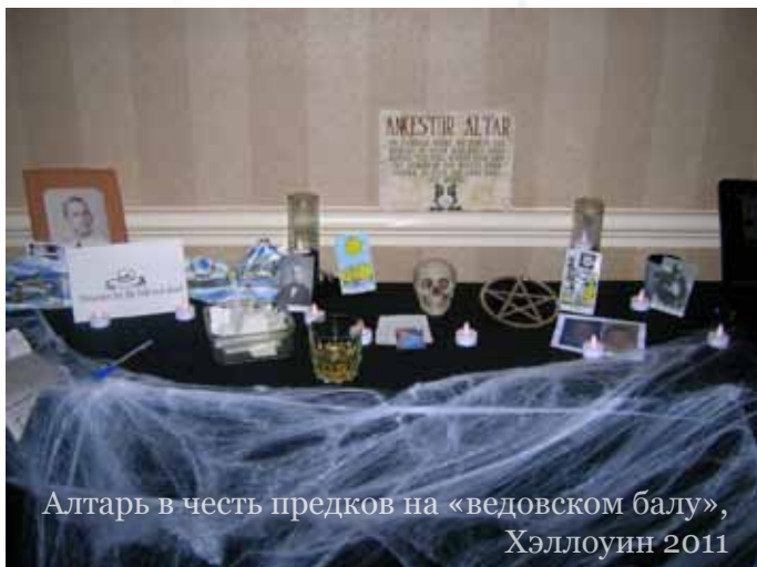
Алтарь в честь предков на «ведовском балу», Хэллоуин 2011

Во-первых, распространенное представление среди российских виккан о том, то Америка – языческий рай, а американские язычники как-то качественно отличаются от отечественных – совершенно неверное. Они не обладают никакими сокровенными тайнами, которые недоступны нам. Они не отличаются какой-то заповедной «мудростью», которой нам так не достает. Их встречи, их ритуалы и их совместные акции проходят так же, как наши. На них тоже опаздывают (ритуал Йоля у унитариев пришлось отложить на полчаса из-за опоздания главного участника). На «барабанном круге» под Хэллоуин, о котором я уже писал («Ночь, когда поднимается завеса», http://www.versacrum.narod.ru/articles/jefferson.html ), заводилам с барабанами и трещотками приходилось долго «раскачивать» публику, прежде чем начался собственно нормальный танец. Некоторые ритуалы мне показались более интересными и мощными, чем другие. При этом в целом уровень организованности при проведении обрядов, в которых участвует много человек, выше, чем у нас. Общественное признание язычников, которому так завидуем мы, в Америке не так уж и широко. Культура США, даже в регионах, славящихся своей открытостью и толерантностью (округ Колумбия входит в их число), испытывает сильное влияние религиозного «истеблишмента» (протестанты, католики, иудеи). Это плодотворное влияние, но в результате малые группы оказываются на периферии общественной жизни, и